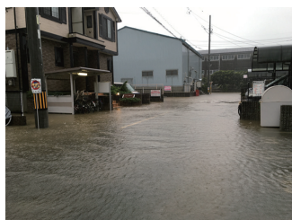
弥富市内での冠水被害