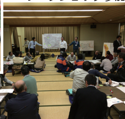
防災計画 ワークショップ参加