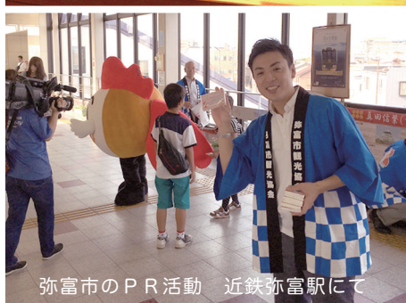
弥富市のPR活動 近鉄弥富駅にて