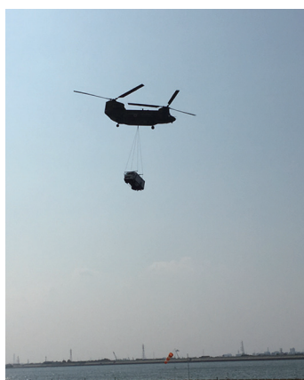
愛知県と合同の弥富市防災訓練