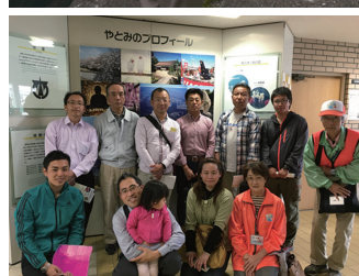
弥富市を盛り上げる サポーターの会参加