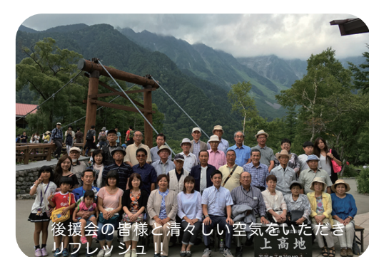
後援会の皆様と清々しい空気をいただき リフレッシュ!!