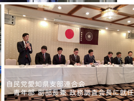
自民党愛知県支部連合会 青年部 副部長兼 政務調査会長に就任