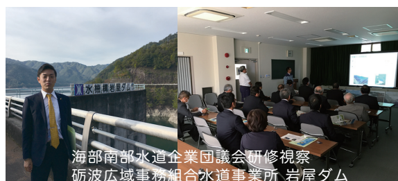
海部南部水道企業団議会研修視察 砺波広域事務組合水道事業所 岩屋ダム