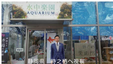
静岡県 時之栖へ視察