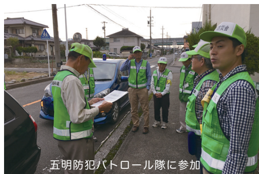
五明防犯パトロール隊に参加