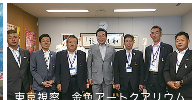
東京視察 金魚アートアクアリウム