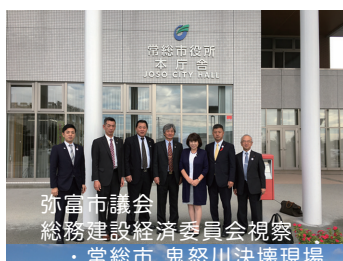
弥富市議会 総務建設経済委員会視察 ・常総市 鬼怒川決壊現場