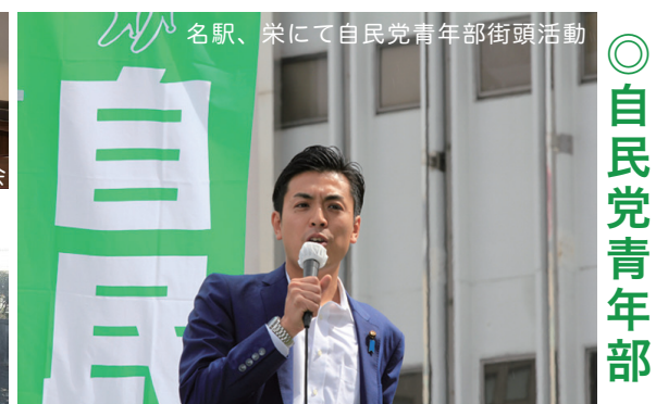
名駅、栄にて自民党青年部街頭活動