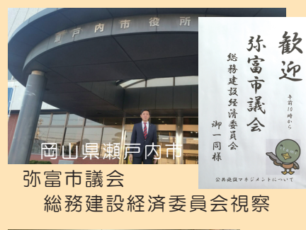
岡山県瀬戸内市 弥富市議会 総務建設経済委員会視察