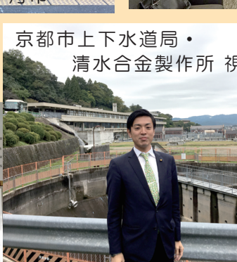
京都市上下水道局・ 清水合金製作所 視察