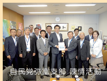
自民党弥富支部 陳情活動